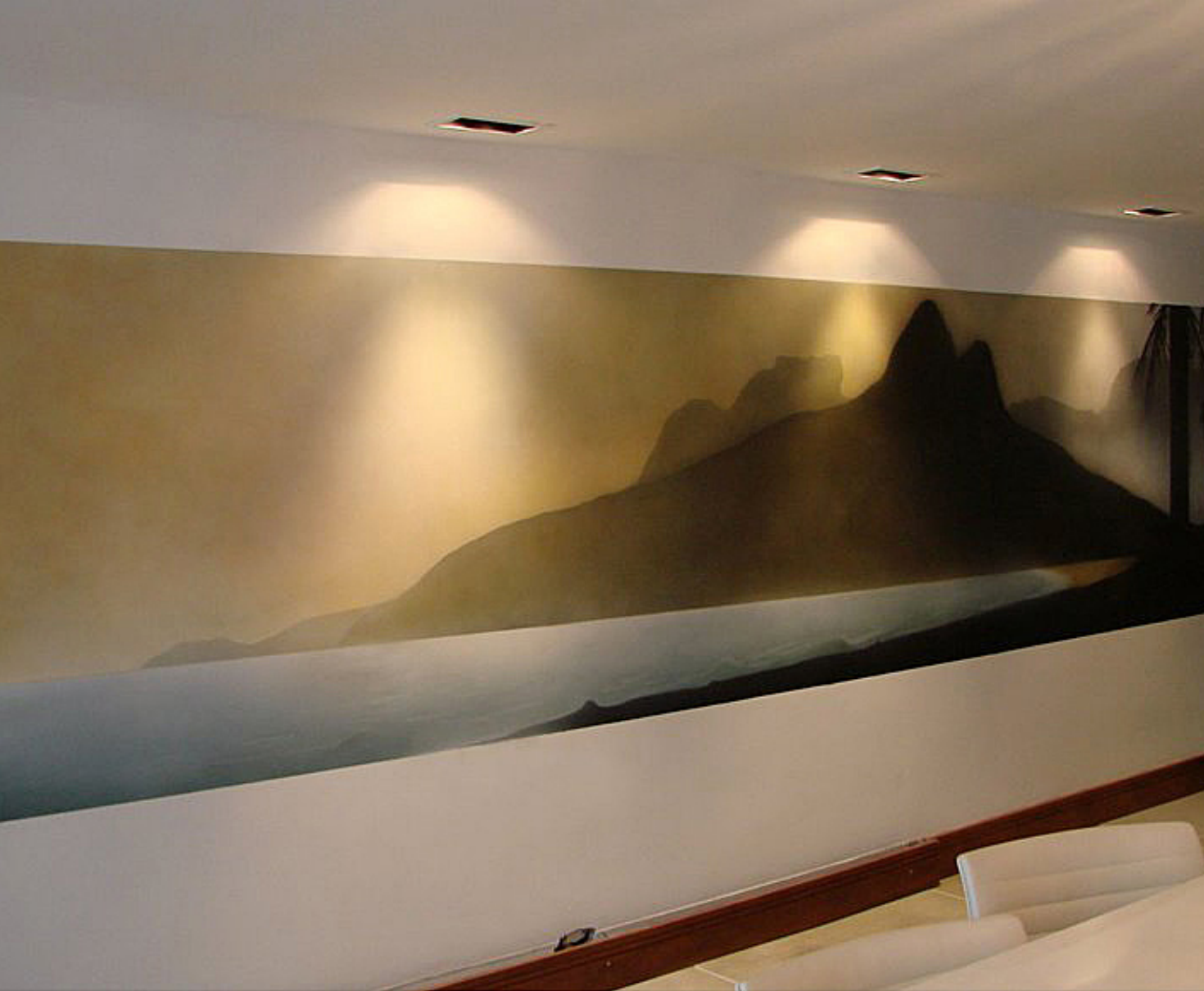
Trabalho da Artecore numa sala em Ipanema: cerca de 6m de largura