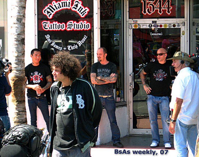
Estúdio Miami Ink: série de TV

E: A que você atribui o fato dela ainda ser vista como uma atitude transgressora?