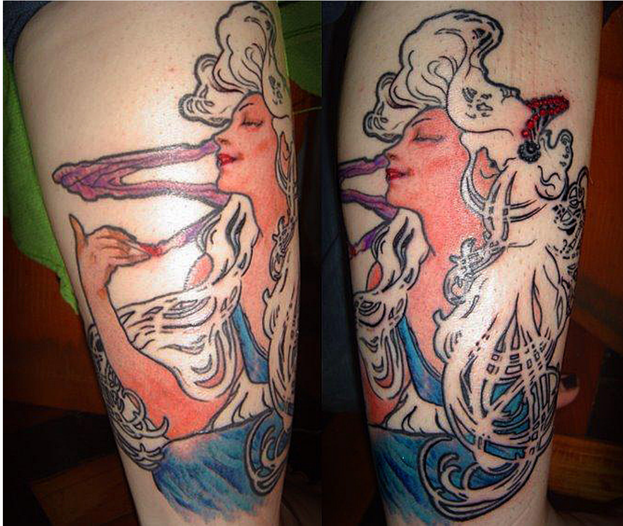
Art Nouveau francesa: propaganda de cigarro

Tatuadores, embora a atividade dos tatuadores seja uma atividade autônoma. Quanto à legislação e o Ministério da Saúde, existe uma responsabilidade do profissional com o equipamento e o seu uso – assim como existem nos cabeleireiros e salões, por exemplo –, que exige a esterilização dos materiais utilizados no processo da tatuagem. Então, as ferramentas de trabalho dos tatuadores devem deixar de ser esterilizadas na “estufa de alta temperatura” para ser tratadas na “autoclave”. Esta, por sua vez, é a mesma peça que o dentista utiliza, já que ele também trabalha com um material que pode ser perigoso para algumas doenças sanguíneas. A autoclave é um material hospitalar, em que você mantém a esterilização. Já a estufa esteriliza, mas não mantém essa esterilização.