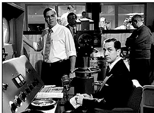
Boa noite, boa sorte: a filmagem em preto e branco acentua o clima de tensão do filme

No âmbito dos filmes de cunho mais documental, destaca-se Preto e branco (2004), de Carlos Nader, no qual apesar de não remeter ao clássico filme preto e branco na concepção do mesmo, traz personagens das duas raças, como que fazendo um contraponto, para abordar as relações raciais entre cidadãos comuns da cidade de São Paulo. “Mostrando no decorrer do filme uma fotografia centrada nos personagens paulistanos das duas raças, o diretor cria uma série de argumentos sobre a coexistência entre elas, partindo da idéia de que a relação entre bran-